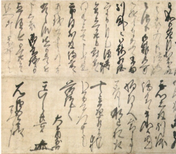
大石内蔵助書状(石東源五兵衛宛・部分) 江戸時代中期 平成29年度購入