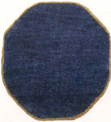
丸形赤穂緞通 大正～昭和初期 平成28年度購入