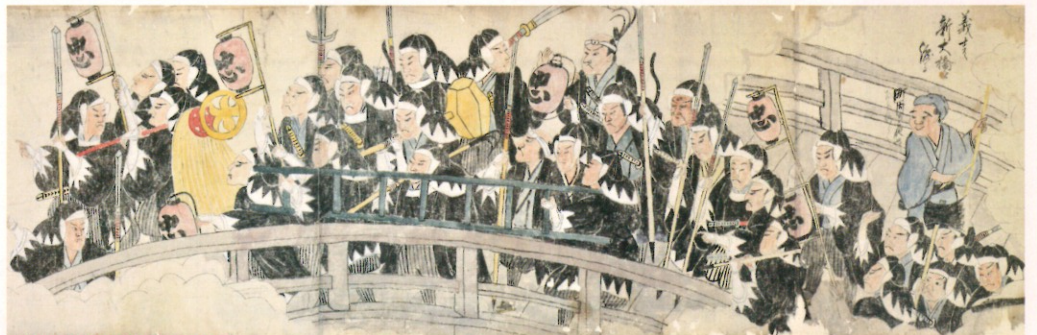
赤穂義士絵巻(部分) 江戸時代後期 平成27年度寄託