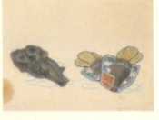
森家具足園貼交屏風 鯉江高風筆 文政12年(1829) 平成26年度寄託