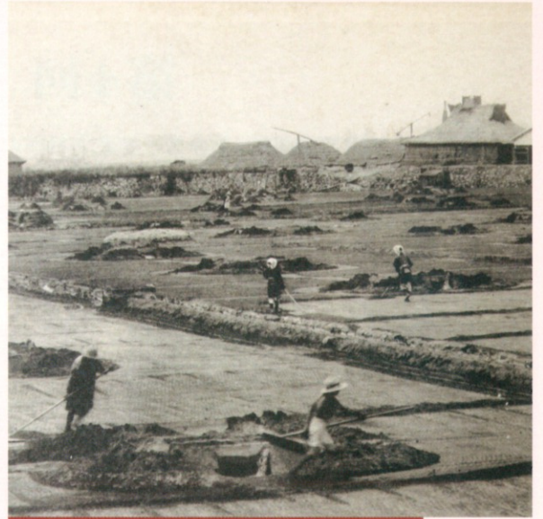
絵葉書「(赤穂名所)塩田作業ノ実況」(部分) 大正～昭和初期 平成29年度購入